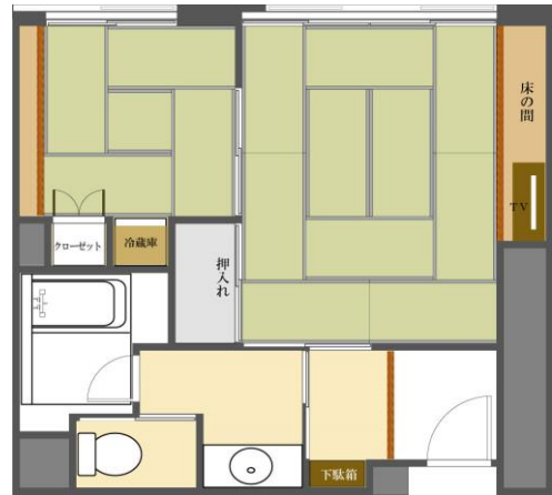
喜多館和室、間取り