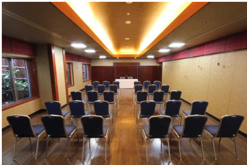
会議室一例、東館 3 階 雅の間