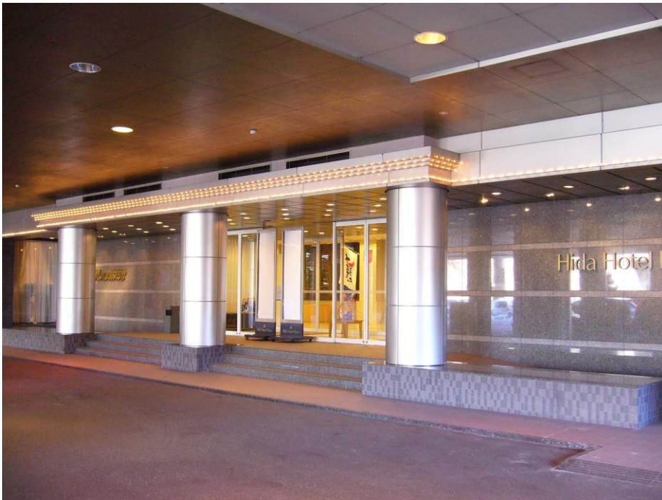
正面玄関前ロータリー